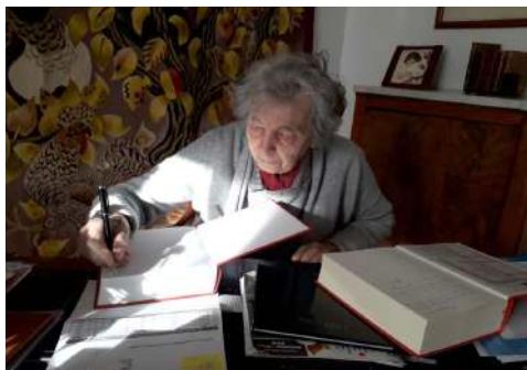
Dédicace : la Bible de Jérusalem et la Table Pastorale de la Bible : livres offerts à Keur Moussa (mes précieux instruments de travail à Terreville) (Paris 2021)